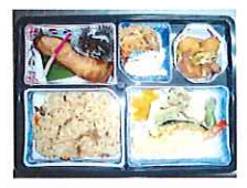
写真は昼食弁当の一例です