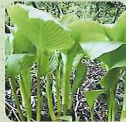
うるい (和名/オオバキボウシ)

群生せず貴重なため、山菜の王様とも呼ばれている。アスパラのような風味で、主におひたしで食べられる。