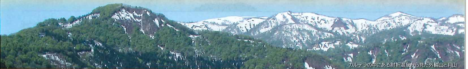
カルデラの中にある肘折温泉から見た外輪山と月山

授業内容 「山菜学」、「山菜の調理・保存学」、「山菜学実習」(わらび採体験)、「山菜給食」