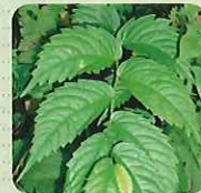
赤みず (和名/ウワバミソウ)

山菜の代表格。とてもあくが強く、重曹や天日干しであく抜きを行う。歯ごたえがよく、用途も様々。