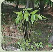
こしあぶら (和名/コシアブラ)

沢沿いなどの湿気のある場所に群生。軽いぬめりと仄かな甘みが特徴。こまあえやおひたしで食べられる。