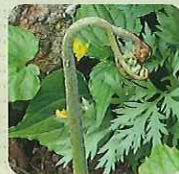
わらび (和名/ワラビ)

若竹の清涼しい香りと独特の歯ごたえが人気の山菜。味噌汁・煮物・天ぷらなどで食べられる。