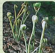
ぜんまい (和名/ゼンマイ)

ぬめりとシャキッとした食感が特徴の山菜の代表。おひたしや油炒め、味噌汁など用途も様々。