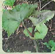
ぼうな (和名/ヨブスマソウ)

高い木になる新芽で、採取が難しい。芳香が強くと、モチツとした濃厚な味が特徴で天ぷらや和え物に利用される。