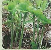
あいこ (和名/ミヤマイラクサ)

半日陰に生えており、葉はもみじに似る。ほろ苦く、独特の香りがある。主におひたしなどで食べられる。