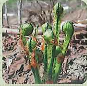
こそみ (和名/ウサソテツ)