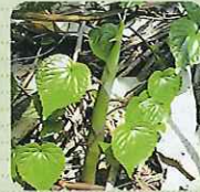
たけのこ (和名/ネマガリダケ)

日の良く当たる場所に自生。独特の香りがあり、調理も手軽。油炒め、煮物、天ぷらなどで食べられる。