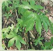
しどけ (和名/モミジガサ)