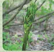
しおで (和名/シオデ)